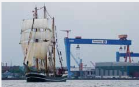
Foto: Seilskipet / Segelschiff „Thor Heyerdahl“.