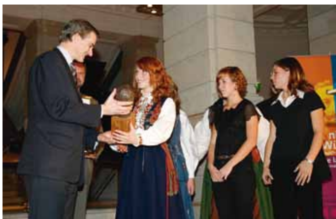
Foto: Jonas Gahr Støre overrekker Willy-Brandt-prise 2006 til elever ved de prisvinnende skolene / Jonas Gahr Støre überreicht den Willy-Brandt-Preis 2006 an Schülerinnen der ausgezeichneten Schulen.

Mit ihrer langjährigen aktiven Arbeit im Schüler-Austausch zwischen Norwegen und Deutschland trugen die drei Schulen zu wachsenden Kenntnissen über die Kulturen beider Länder und damit zu einem größeren Verständnis zwischen Norwegen und Deutschland – auch auf persönlicher Ebene – erheblich bei.