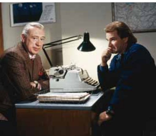
Foto: Vinner av Willy-Brandt-Prisen i 2002 / Willy-Brandt-Preisträger 2002. Horst Tappert alias Derrick. 1993. © dpa – Bildfunk

Die Preisverleihung fand am 4. Juli 2001 in Anwesenheit des norwegischen Außenministers Thorbjørn Jagland und des Regierenden Bürgermeisters von Berlin Klaus Wowereit im Rathaus Schöneberg in Berlin statt.