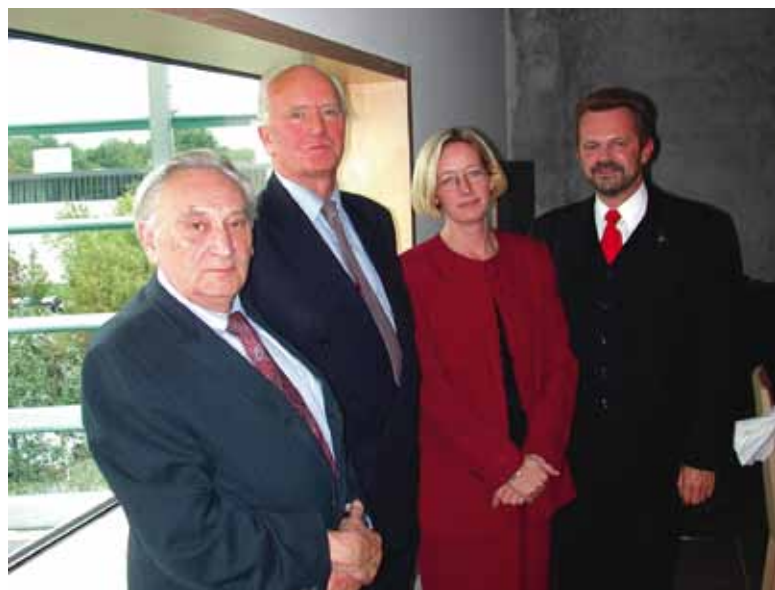
Foto: Etter stiftelsens grunnleggelse, 2000 / Nach der Stiftungsgründung, 2000. Vier Vorstandsmitglieder: Prof. Egon Bahr, Thorvald Stoltenberg, Marit Arnstad, Franz Thönnes (f.v. / v.l.n.r.).

Willy Brandts navn er uløselig knyttet til fremme av demokrati og forståelse mellom nasjoner. Han overlevde nazistenes herredømme i Tyskland blant annet gjennom opphold i Norge og var norsk statsborger mellom i 1940 og 1948. I Willy Brandts ånd ønsker den norsk-tyske Willy-Brandt-stiftelsen å bidra til videre utvikling av forholdet og enda bedre gjensidig forståelse mellom de to landene. Stiftelsen formidler gjensidig kunnskap om samfunnsliv, kultur og språk i begge land. Med formål å