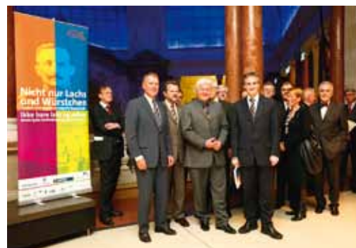
Foto: Utdelingsseremonien for Willy-Brandt-prisen i 2006 fant sted i nærvær av Jonas Gahr Støre og Frank Walter Steinmeier, i forbindelse med åpningen av utstillingen "Ikke bare laks og pølser". / Im Rahmen der Ausstellungseröffnung „Nicht nur Lachs und Würstchen“ wurde der Willy-Brandt-Preis 2006 in Anwesenheit von Jonas Gahr Støre und Frank Walter Steinmeier verliehen.

Prisutdelingen fant sted 10. november 2006 i Kommunikationsmuseet i Berlin. Tysklands utenriksminister Frank Walter Steinmeier og Norges utenriksminister Jonas Gahr Støre delte ut prisen.